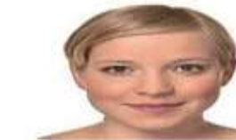
Улыбка "на заказ"