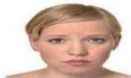
Интерес Вежливый вопрос